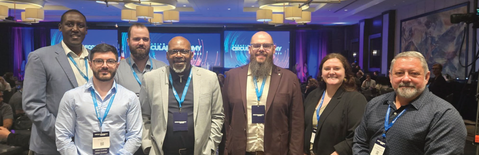
Sommet canadien de l'économie circulaire. Avril 2025.

Ces outils visent non seulement à soutenir les organismes membres dans l'amélioration continue de leurs services, mais également à renforcer la qualité, la cohérence et la crédibilité des interventions réalisées à travers le réseau.