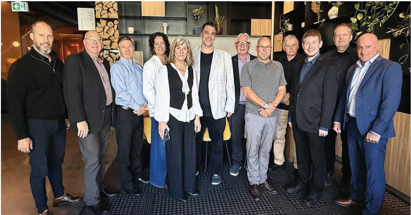
Rencontre du conseil d'administration du RDÉE Canada. Octobre 2025.

Les plateformes numériques du RDÉE Canada ont continué de connaître une croissance importante au cours de la dernière année. Cette progression s'explique notamment par l'augmentation du volume de contenu produit, le développement de nouvelles campagnes nationales et la volonté de mieux valoriser les initiatives du réseau et de ses membres.