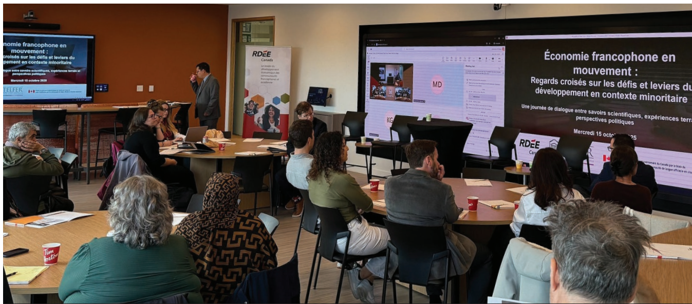
Journée d'échanges sous le thème « L'économie francophone en mouvement » à l'Université d'Ottawa. Octobre 2025.