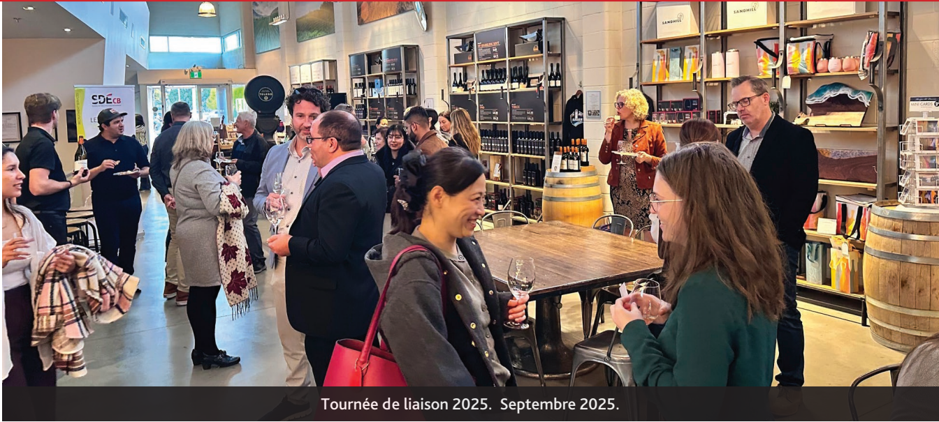
Tournée de liaison 2025. Septembre 2025.