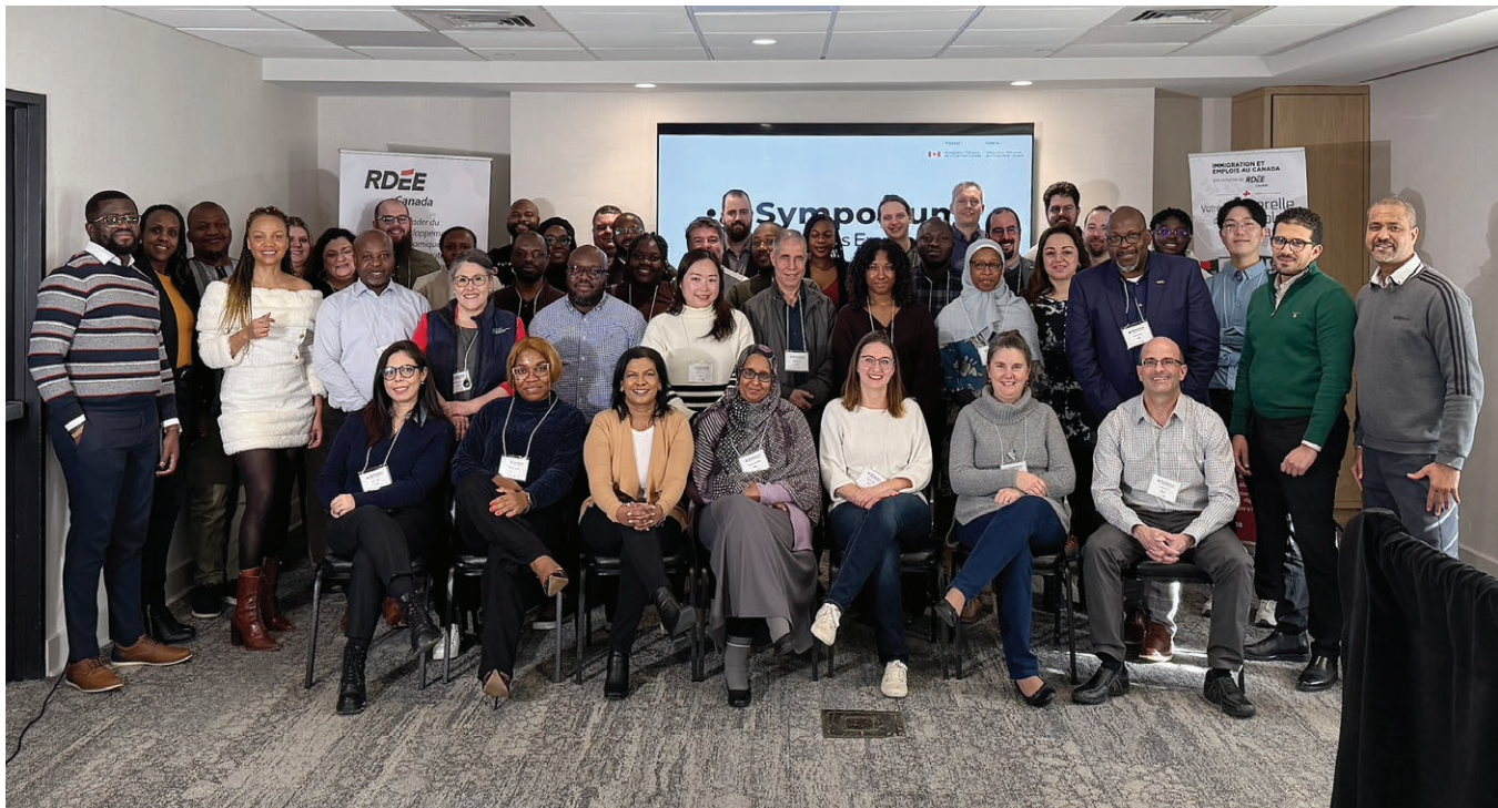
Symposium annuel du RDÉE Canada. Les 12 membres du réseau. Janvier 2026.

Les rencontres tenues en présentiel et en virtuel au cours de l'année ont permis aux membres de partager leurs réalités, leurs projets, leurs enjeux et leurs pratiques. Cette approche favorise une meilleure circulation de l'information à travers le réseau tout en permettant aux organismes membres de mieux s'inspirer les uns des autres.