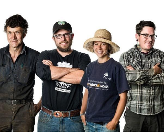
Les quatre fondateurs de la Ferme Terre Partagée