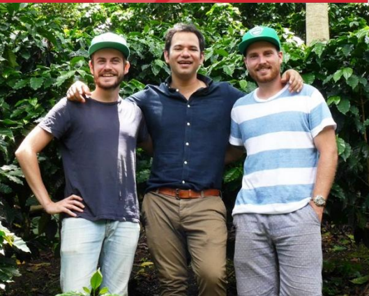
Les trois propriétaires de Wize Monkey